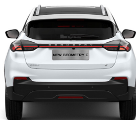
מגוון אביזרי נוחות ומיגון