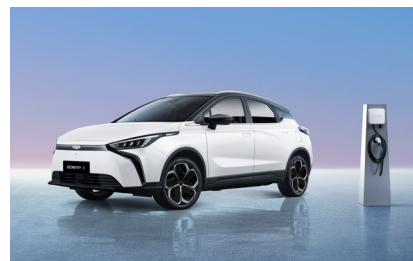
מגוון אביזרים משלימים לטעינה

*השירותים כרוכים בתוספת תשלום וכפופים לתנאי השירות הנבחר.