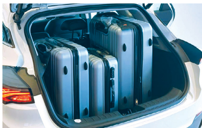
שדרוג נפח אחסון תא מטען